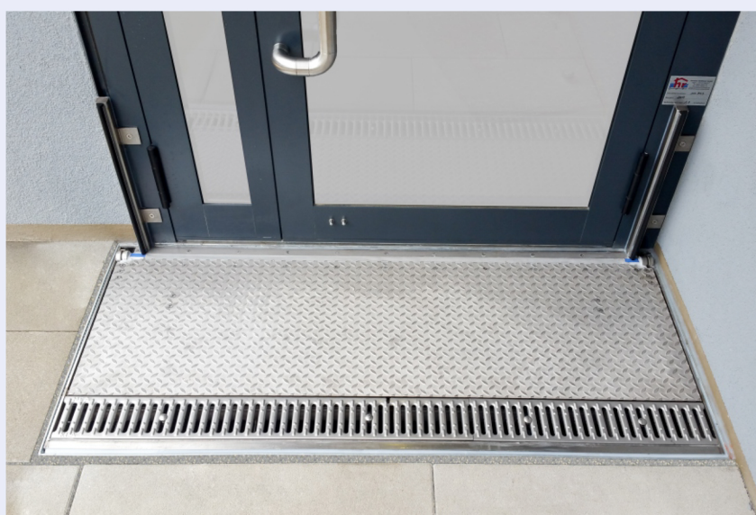
Vollautomatisches CHT-Sicherheitsklappschott in Sicherheitsposition

Dank innovativer Schwimmertechnik öffnet und schließt dieses System selbstständig, stromunabhängig und ohne auf sonstige Fremdenergie* angewiesen zu sein.