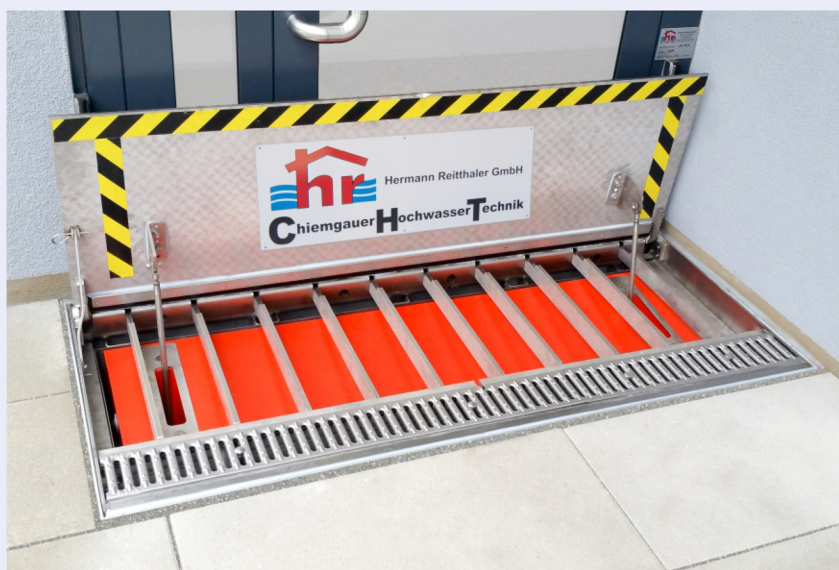
Vollautomatisches CHT-Sicherheitsklappschott in Hochwasserschutzposition